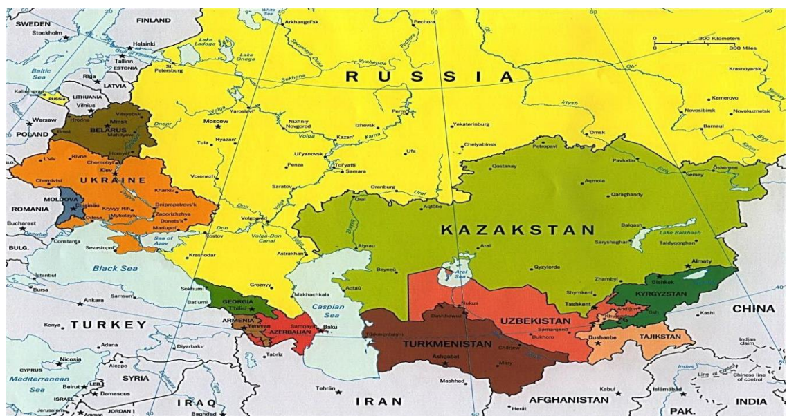
Նկար 1. ԱՊՀ երկրների քաղաքական քարտեզը

Ինչ վերաբերվում է երկկողմ և բազմակողմ ընթացակարգերին և և սկզբունքներին, ապա դրանք մշակվել և արդյունավետ կիրառվում են ՄԱԿ-ի, Համաշխարհային բանկի, Արժույթի միջազգային հիմնադրամի, ԱՀԿ-ի և այլ միջազգային կառույցների կողմից: Ավելին, դրանք հարստանում են համաշխարհային տնտեսության ներսում նկատվող նոր միտումների և զարգացումների անմիջական ազդեցությամբ: Այս առումով հատկապես կարևորվում են ԱՀԿ գործառույթները, երկրների համար պարտադիր վավերացման ենթակա հիմնական համաձայնագրերը, սկզբունքները և առևտրի միջազգային կանոնների պահպանման ապահովման մեխանիզմները: 3 Մինչ ԱՀԿ ստեղծումը, նման գործունեություն էր իրականացվում նաև դրա նախատիպը հանդիսացող Սակագների և առևտրի ընդհանուր համաձայնագրի /ՍԱԸՀ/ շրջանակներում, որն, ըստ էության, կարևոր դեր խաղաց ինչպես միջազգային առևտրային ռեժիմի