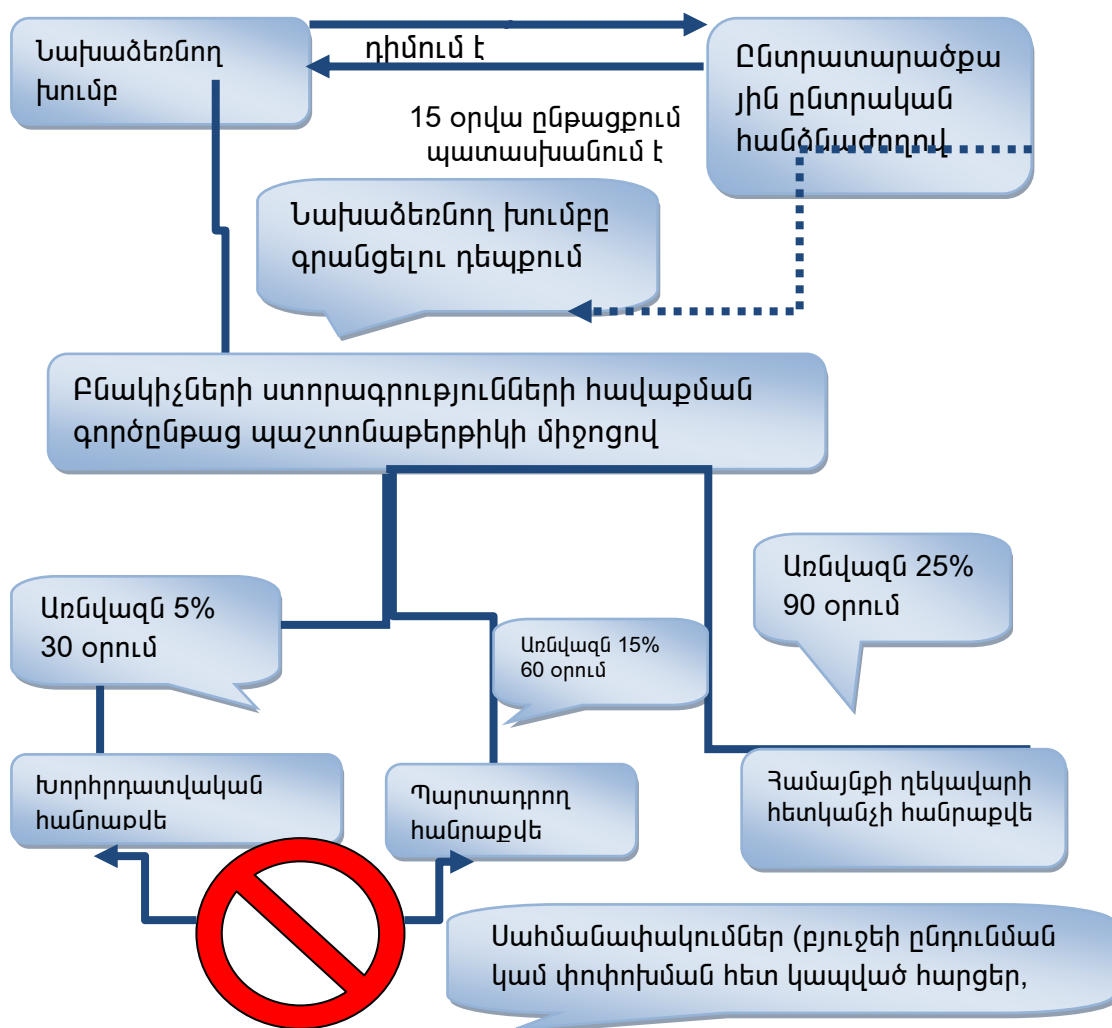
Գծապատկեր 3. Տեղական հանրաքվեի առաջարկվող կառուցակարգը ՀՀ-ում

հավաքման գործընթացի համար օրենքով պետք է սահմանվի 90 օր ժամկետ: Սահմանված ժամկետում ստորագրությունների անհրաժեշտ քանակը չապահովելու դեպքում համայնքի ղեկավարի հետկանչի հարցով տեղական հանրաքվե անցկացնելու նախաձեռնությունը պետք է համարվի ավարտված: Հանրաքվեի նշանակման գործընթացի մնացած քայլերը կարող են իրականացվել ներկայիս օրենքով 2 սահմանված կարգին համապատասխան: ՀՀ-ում տեղական հանրաքվեի կառուցակարգի տրամաբանությունը ներկայացված է գծապատկեր 3-ում: